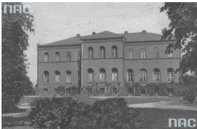
Haraldove Anshovm Cyfrowe, sygn. 1-U-4591

Pałac biskupi z 1 połowy XIX w. miał pierwotnie formę neoromańską. W latach 1927-1928 przebudowano go w stylu neoklasycystycznym z polecenia biskupa Stanisława Wojciecha Okoniewskiego.