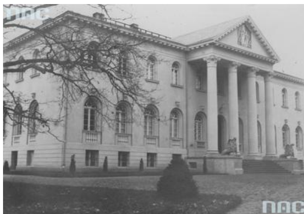
Haraldove Anshovm Cyfrowe, sygn. 1-U-4592